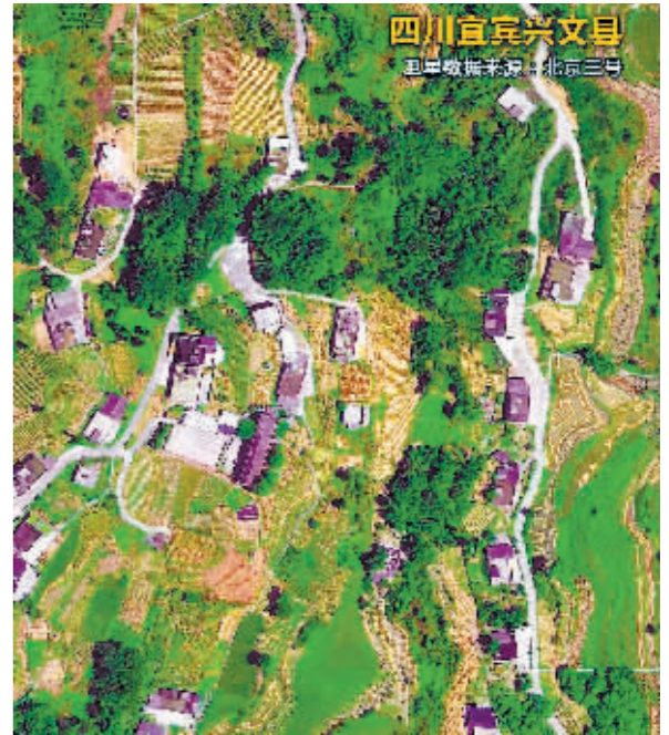
四川宜宾兴文县, 在阳光的照射下, 田野闪烁着金色的光芒, 梯田蜿蜒层叠、纵横交错, 与周边苍翠的群山勾勒出一幅乡村振兴的美丽画卷。

一幅幅收获的画卷正在中华大地上徐徐展开。跟随卫星的视角俯瞰祖国大江南北, 红橙黄绿勾勒出一幅色彩斑斓的“五谷丰登”图——