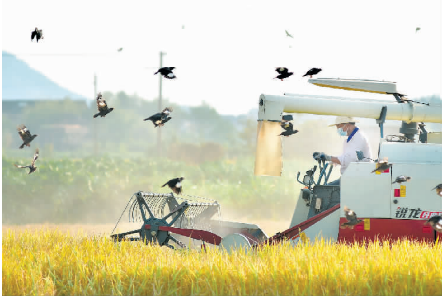
农民驾驶收割机收割水稻。