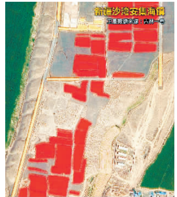
新疆沙湾安集海镇, 3.6万亩辣椒陆续成熟, 火红的辣椒大面积铺展在黄绿交织的田野周围, 绘出一幅红红火火的丰收景象。