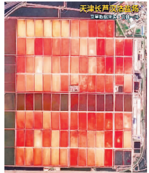
天津长芦汉沽盐场, 正是海盐丰收季, 俯瞰广袤的滩涂, 大面积的盐田整齐划一, 一隅一隅的色彩, 宛如一块巨大的天然调色盘……