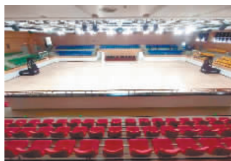
修缮一新的体育馆内的篮球场。

为保安全、保质量、保进度推进项目建设,跑出项目建设“加速度”,为省运会举行提供场馆保障,在双馆建设期间,哈城投集团主要领导多次到现场调研,在工程质量、安全作业、文明施工和责任担当等方面建立激励监督推进体系,协同攻坚克难,科学统筹疫情防控和项目建设,实行 24 小时不间断工作模式,一分一秒抢进度。经过参建全体单位数月连续奋战,秋高气爽之时,双馆以崭新的面貌亮相,无疑将进一步带动起市民运动健身热潮。