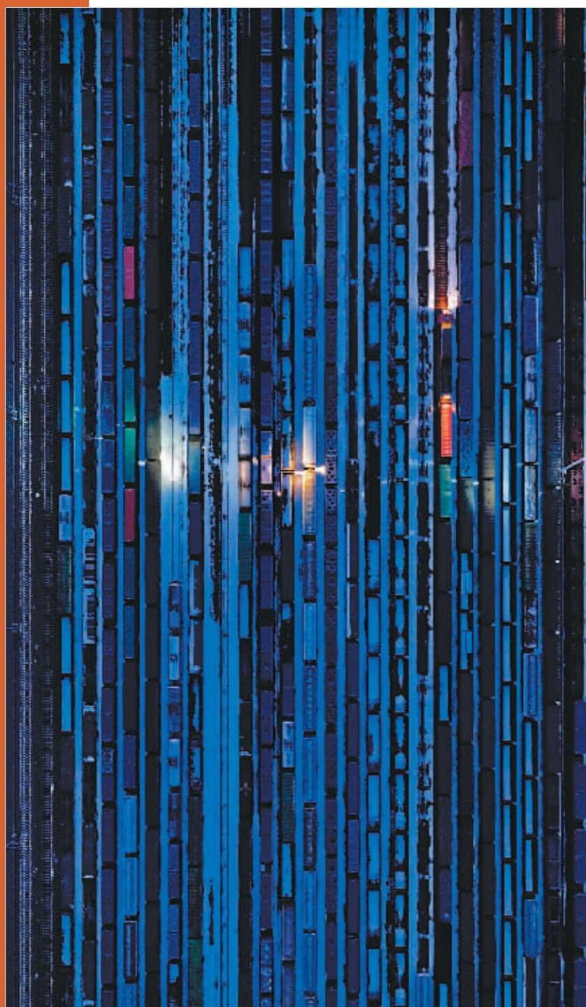
航拍哈尔滨火车站。