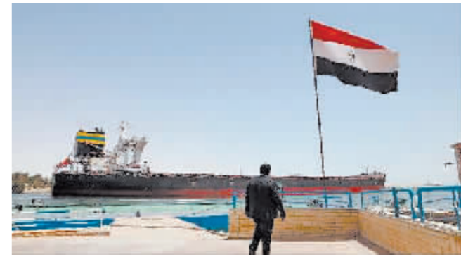
航行在苏伊士运河上的货船。

据新华社电 埃及苏伊士运河管理局17日发表声明说,将于2023年1月上调苏伊士运河的船舶通行费。