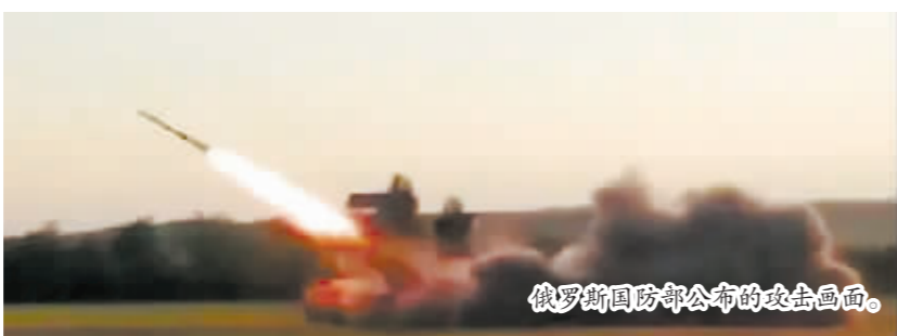
俄罗斯国防部公布的攻击画面。