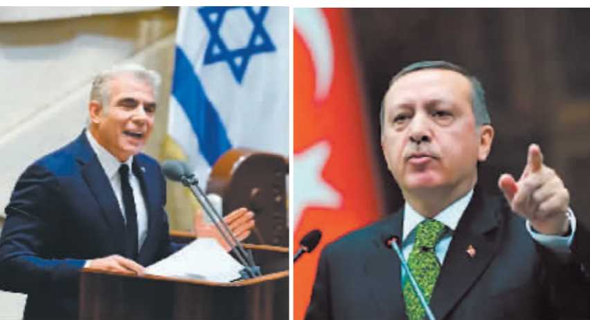
以色列总理拉皮德。