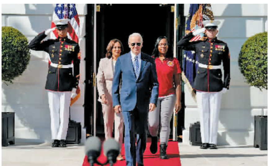
拜登夫妇在白宫庆祝《通胀削减法案》的活动。

据美国《纽约邮报》报道，当地时间13日，就在美国8月通胀率数据公布数小时后，白宫为《通胀削减法案》获批举行了一场庆祝派对，引发美国网友群嘲。