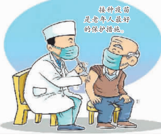
接种疫苗是老年人最好的保护措施。