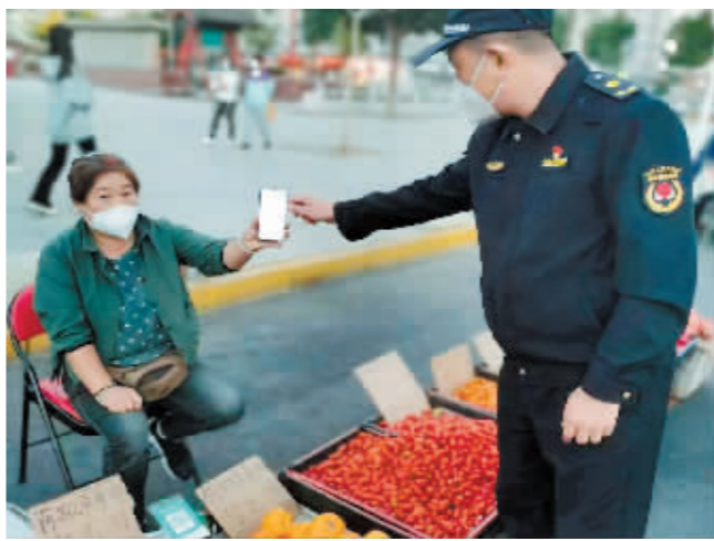
城管人员检查摊主核酸检测情况。

此外,规范经营行为,严禁在夜市使用小煤炉和伪劣、过期、未检验的煤气罐等;对私拉乱接电线、电灯、电源、灯光牌匾等进行制止、查处,确保夜市摊区内用火、用电等方面安全。