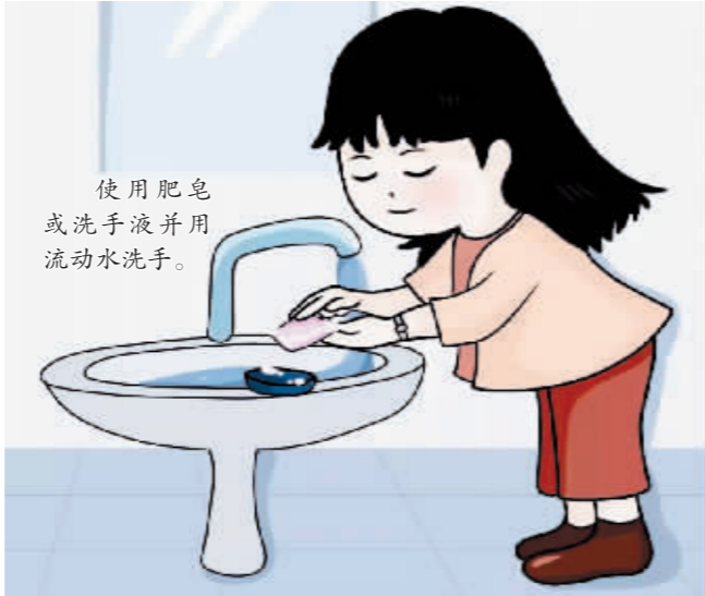
使用肥皂或洗手液并用流动水洗手。