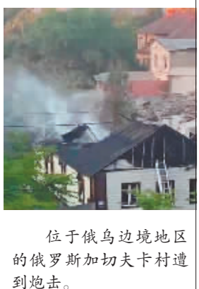
位于俄乌边境地区的俄罗斯加切夫卡村遭到炮击。

上周六,意大利抗议者在那不勒斯围攻了该国外长迪马约。据英国《快报》报道,一名男子一边试图靠近迪马约,一边大喊:“走!走开。那不勒斯不要你!”