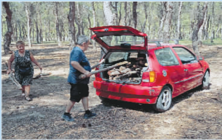
为削减“天价”燃气账单,希腊民众给柴煮冬。