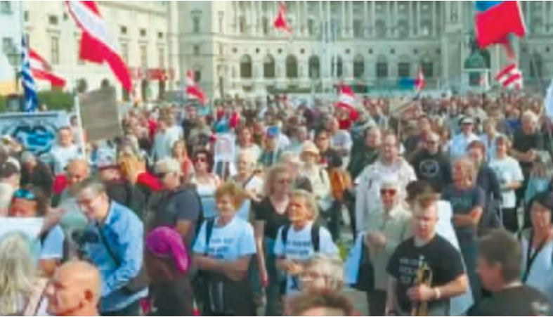
奥地利民众大规模示威游行。

乌克兰近日向东部和南部地区开展反攻。乌克兰总统泽连斯基在9月12日的例行视频讲话中表示,从9月初开始,乌克兰武装部队已经收复东部和南部6000平方公里土地。