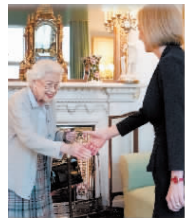
9月6日,英国新任首相特拉斯会见英国女王伊丽莎白二世。

随着女王的去世,关于英国君主制的存废再度被推到全球聚光灯前。英国《卫报》专栏作家阿尔登曾提出,英国君主实际上拥有拒绝首相解散议会、重开选举和选择首相人选的两大权力。