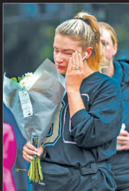
在英国伦敦白金汉宫外,一名女子擦拭泪水。

中午时分,威斯敏斯特教堂、圣保罗大教堂和温莎城堡敲响钟声。下午,海德公园、伦敦塔等地鸣放礼炮。傍晚,圣保罗大教堂举行祈祷仪式。