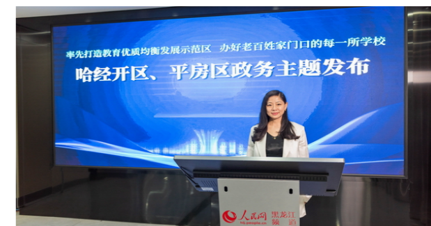
平房区教育局局长 李文慧

做而实,抓好常规管理促“双减”。以常规管理精细化、教学模式科学化、学生评价多样化、课后辅导层次化、学生活动课程化的“五化”管理推进“五实”课堂建设。教育行政部门和教研部门“双轮驱动”,联动开展教研和教育教学常规检查,实现了以检促发展,以查促成长。组织开展以“作业阶梯设计”为主题的学科培训、主题研讨、蹲点教研等活动,调控作业总量,抓实作业管理,真正把“双减”工作落在实处。谋而定,深化教学管理提质量。疫情期间,平房区各校借助网络平台建立了班级“虚拟教室”,组织学生开展了一系列项目式学习研究,将作业难监控、难检查、难评等问题一一攻破。平房区教育局建立了区、校两级巡课台账,包保到校、线上与线下教学无缝切换,保证了线上线下教学质量。思而变,完善课后服务保民生。确保课后服务时间到点、受众到面、提质到人。充分挖掘和整合校内外资源,引入非学科类校外公益资源,把参与课后服务的自主权交给学生,新疆一校作为课后服务优秀学校被市主要媒体连续报道。