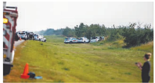
警方和调查人员在抓获嫌疑人的地点工作。

据新华社 加拿大警方7日宣布,4日发生在中部萨斯喀彻温省的持刀刺人事件另一名犯罪嫌疑人已被抓获。加拿大皇家骑警7日在社交媒体上说,当地时间7日15时30分左右,警方锁定犯罪嫌疑人并将其控制。当地时间4日5时40分起,萨斯喀彻温省多地警方陆续接到发生刺人事件的报警电话。调查显示,两名男子实施了系列袭击,随后开车逃离现场。警方确认两名嫌疑人是兄弟关系,其中一人5日被证实已经死亡。这起事件造成包括犯罪嫌疑人在内的11人死亡,19人受伤。