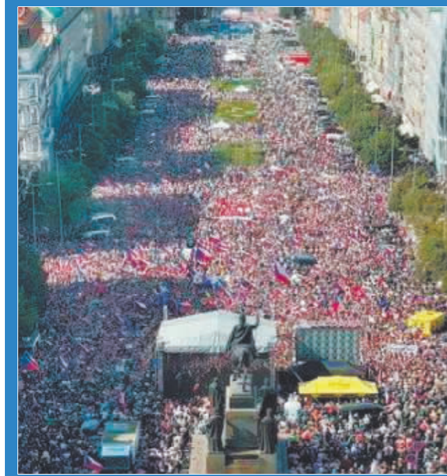
捷克7万多民众举行大规模集会。