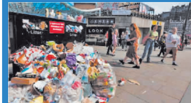
英国环卫工人罢工,街头垃圾成堆。