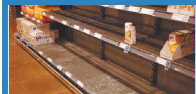
德国柏林一家超市空空的货架。