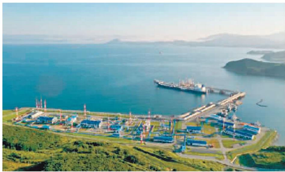
俄罗斯油轮停靠在纳霍德卡的原油码头。