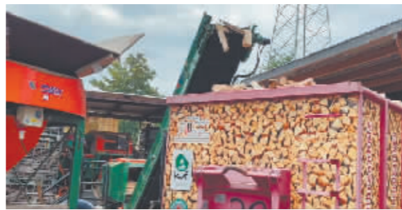
工人在德国木柴加工厂工作。

欧洲人窘迫应对能源短缺困境,反映出欧盟追随美国对俄罗斯施加多轮制裁引起的反噬效应已逐步显现,给欧盟自身带来严重危机。