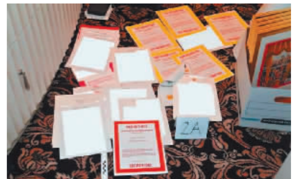
美国司法部公开的“搜家”现场照片,特朗普回应为FBI摆拍。

据新华社电 美国联邦地区法官艾琳·坎农2日下令公开联邦调查局(FBI)上月搜查前总统唐纳德·特朗普住所的查获物品清单。