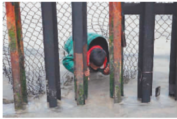
在墨西哥蒂华纳沙滩,一名儿童从美墨边境墙的缝隙中钻过。

据新华社电 美国政府近年被曝强行拆散数以千计非法移民家庭,把儿童带离父母后先是羁押,继而另行安置,此外也会关押独自入境美国的移民儿童,种种问题招致舆论炮轰。而据美国官员最新披露,得克萨斯州休斯敦地区不少移民儿童被安置后“下落不明”,令人担忧是否牵涉贩卖人口、强制劳动甚至儿童色情等情形。