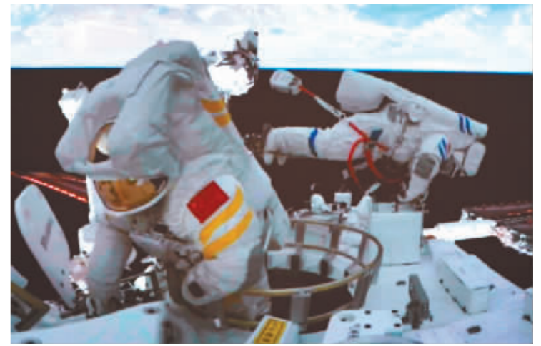
航天员陈冬(右)、刘洋(左)开展舱外操作画面。