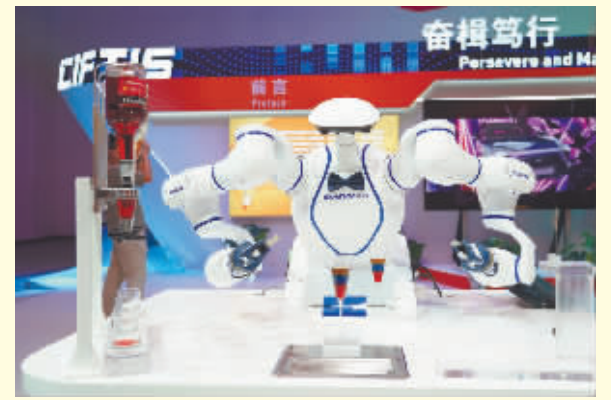
在成就展专区拍摄的一款双臂协作机器人。

2022年中国国际服务贸易交易会于8月31日至9月5日在北京的国家会议中心和首钢园举办。本届服贸会设置中国服务贸易成就展专区,并在多个区域进行成果展示,展现中国服务贸易十年来快速发展的历程和成就贡献。