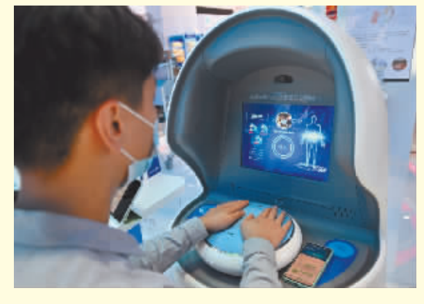
观众在体验免疫力检测。