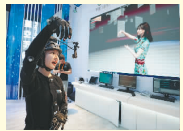
参展商展示一款光学动作捕捉系统。

在2022年中国国际服务贸易交易会现场,众多科技产品亮相展区,吸引观众驻足参观。