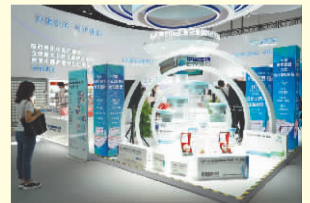
服贸会上的国药集团展台。