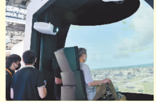
观众在体验沉浸式教学方案。