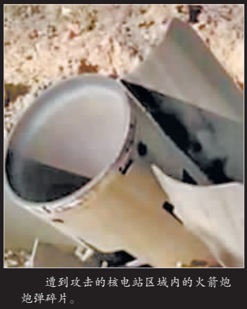
遭到攻击的核电站区域内的火箭炮弹碎片。