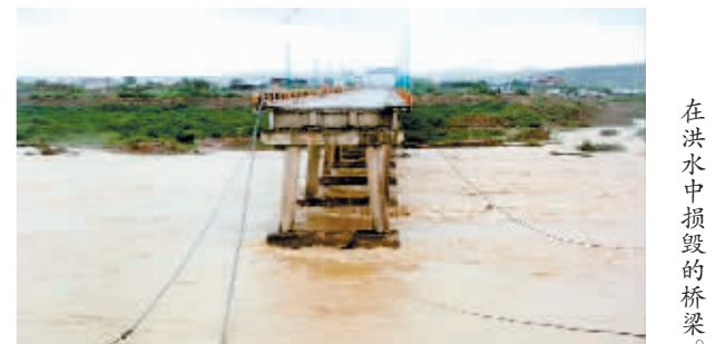
在洪水中损毁的桥梁。

据新华社电 巴基斯坦国家灾害管理局24日说,6月中旬以来,强降雨在巴基斯坦引发的各类灾害已造成903人死亡、近1300人受伤。