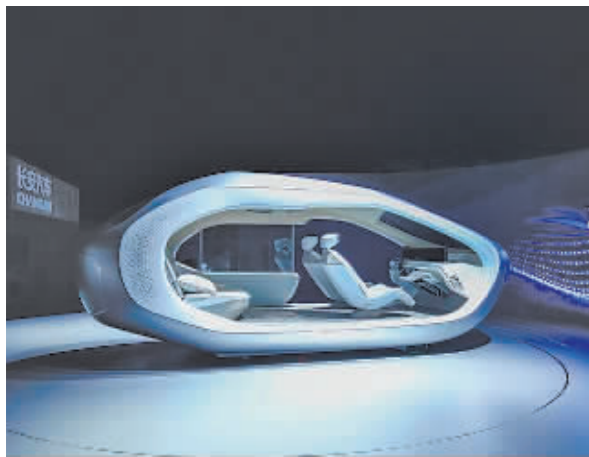
图为长安汽车“数字智能场景空间”。

本届智博会上,长安汽车带来一款“数字智能场景空间”,让人身临其境感知未来的用车场景:无论是观影、办公还是聚会,都可在车内进行,用户从驾驶中解放出来,被开车占用的时间可用于其他事务,汽车从出行工具进化为“智能移动空间”。