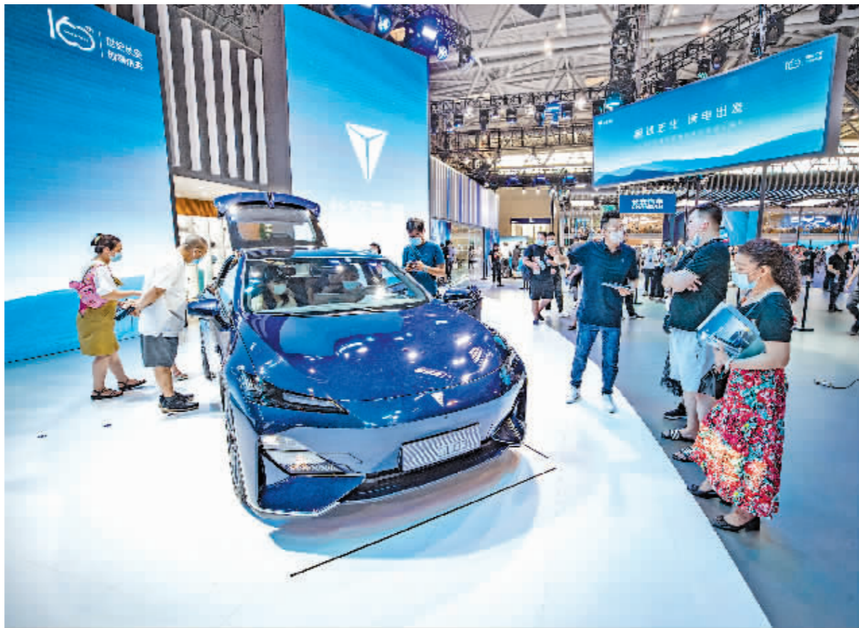
观众在车展上了解一款新能源汽车。

记者了解到,汽车产业向电动化、智能化转型升级过程中,还将形成对城市智能化、道路智能化、交通管理智能化等方面的带动。