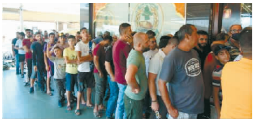
人们在黎巴嫩的黎波里排队购买面包。