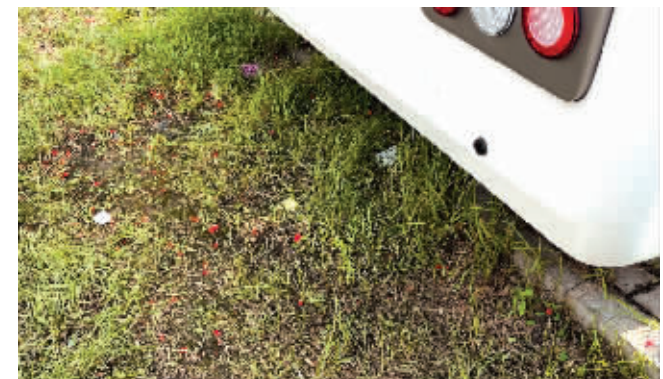
停车场草坪内的垃圾。

本报讯今年夏天,野餐露营逐渐成为哈尔滨本地市民和外来游客青睐的一种新的放松方式,但在江北大剧院旁的房车停车场内,个别游人聚餐吃喝玩乐后,把垃圾留在了草坪里。