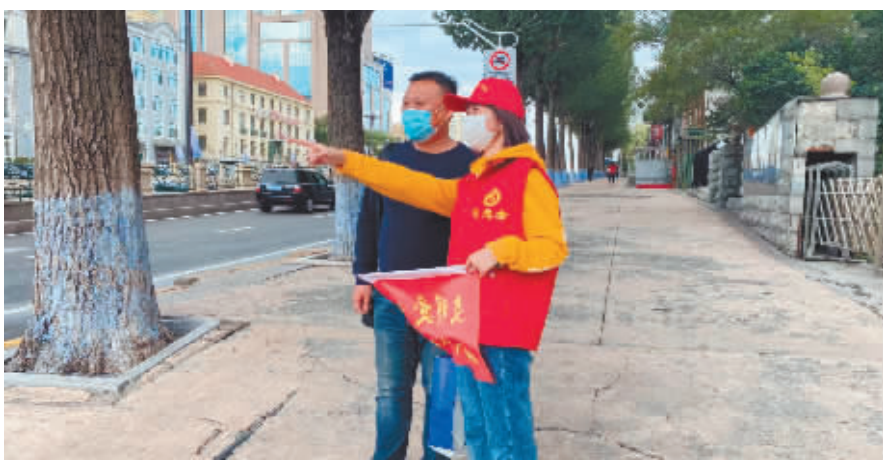
教师志愿者为行人指路。

本报讯(记者 郑炜文/摄)文明交通志愿者,肩负着交通劝导工作的重要任务。近一段时间,继红小学、哈师范附小等学校的教师们利用暑假来到哈市多个交通路口,风雨无阻,坚守岗位,引领文明风尚,展示文明风貌,引导市民安全出行、文明出行,全面助力创城。