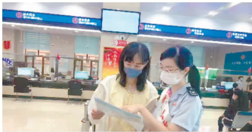
志愿者为办税人解答疑问。

本报讯(记者 康福柱)阿城区税务局结合党史学习教育和“能力作风建设年”活动,扎实推进新时代文明实践站阵地建设、制度运行及活动实践等工作,不断提升新时代文明实践站的服务功能,为市民提供多样化志愿服务。