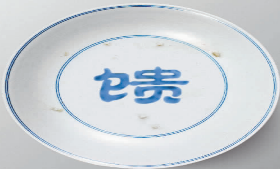
大地馈赠 拒绝浪费