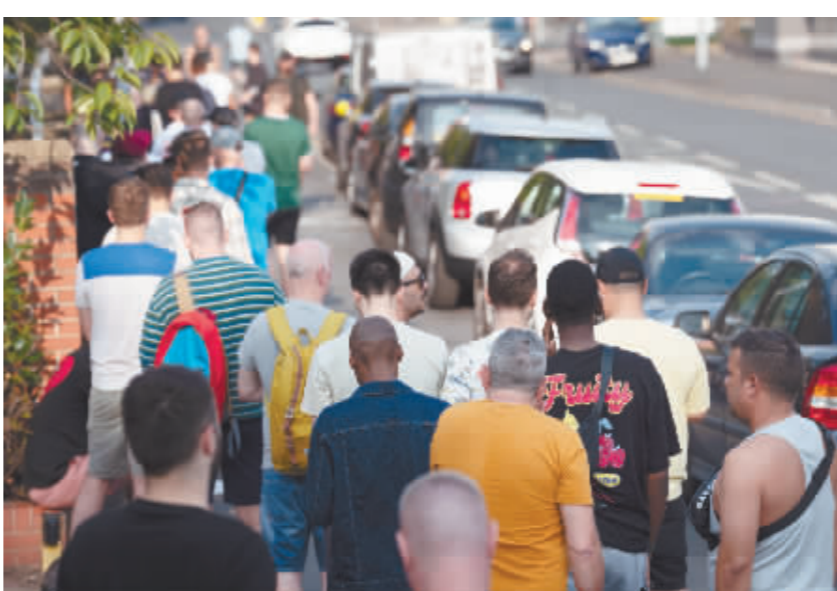
8月14日,人们在英国曼彻斯特一处猴痘疫苗接种点外排队等待接种疫苗。

科学家1958年在一组用于研究的猴子体内首次发现这种病毒,当时这些猴子出现“痘状”传染病,猴痘病毒因此得名。1970年刚果(金)发现首例人感染猴痘病毒,之后病毒主要在非洲西部和中部地区流行。今年5月以来,不少非洲以外国家和地区相继报告猴痘病例。世界卫生组织7月23日宣布,猴痘疫情构成“国际关注的突发公共卫生事件”。