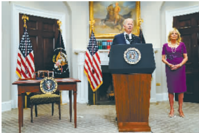
6月25日,美国总统拜登在华盛顿白宫讲话。

拜登在法案签署仪式上声称,《通胀削减法案》“将给美国带来进步和繁荣”,将在未来十年内削减约3000亿美元联邦赤字并创造约7400亿美元财政收入。