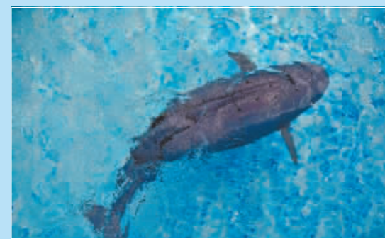
水下智能仿生机器人(鲸鲨)在水中游荡。