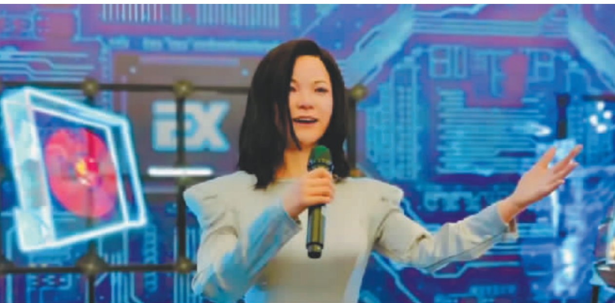
人形机器人“邓丽君”在世界机器人大会上献唱《我只在乎你》。

8月18日,2022世界机器人大会在北京亦创国际会展中心开幕。本届大会以“共创共享 共商共赢”为主题,来自各个领域的500余款机器人如约而至,在4万平方米的展区“炫技”,亮出绝活,向人们展示最炫酷的科技体验。