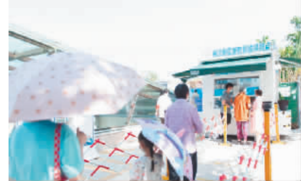
为方便市民就近完成核酸采样,重庆多地设立了方舱式便民核酸采样点。