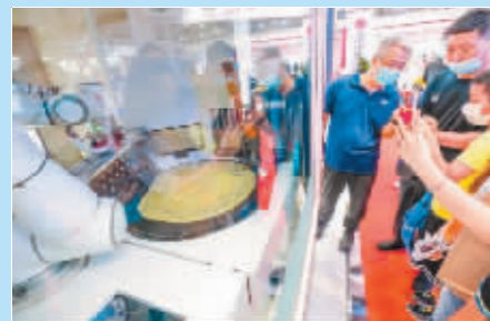
一台餐饮机器人在摊煎饼。 双臂仿生机器人可通过识别模仿工作人员的手臂动作。