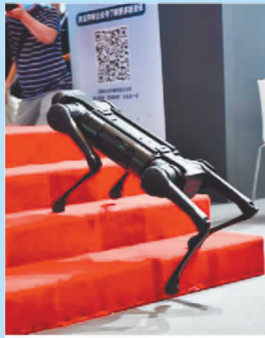
机器狗正在上楼梯。

据了解,本届博览会将持续到8月21日,设置创新技术展区、工业机器人展区、服务机器人展区、特种机器人展区,集中展示机器人先进技术和产品,打造集成应用新高地。