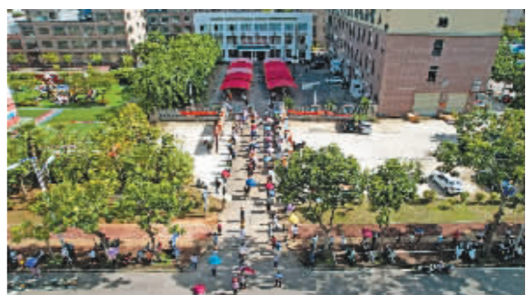
居民排队接受核酸采样。

据新华社电 记者16日从海南省新冠肺炎疫情防控工作新闻发布会上获悉,截至8月15日24时,海南本轮疫情累计报告阳性感染者人数破万。目前,海南正不断加快核酸检测进程,强化农村和社区疫情防控,继续跟踪掌握渔船渔船渔民疫情防控措施落实情况。