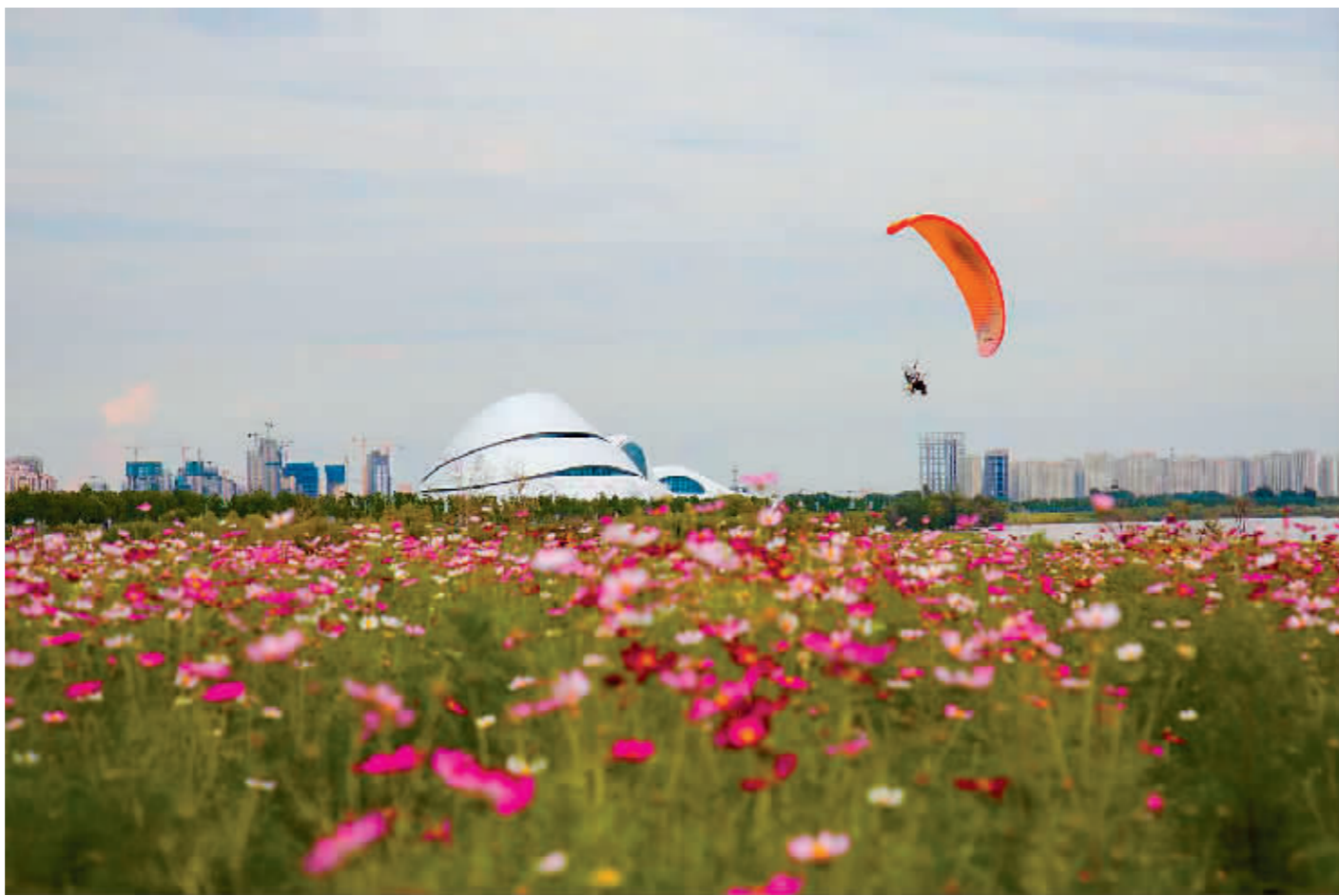
右图:哈尔滨大剧院附近的格桑花海。

据市气象台预计,18日白天哈市有分散性阵雨,18日夜到19日白天,哈市自西向东有一次雷雨天气过程,预计达中雨量级,局部有大雨。降水时可能伴有局地性短时强降水、冰雹等强对流天气,局部阵风可达8到9级。