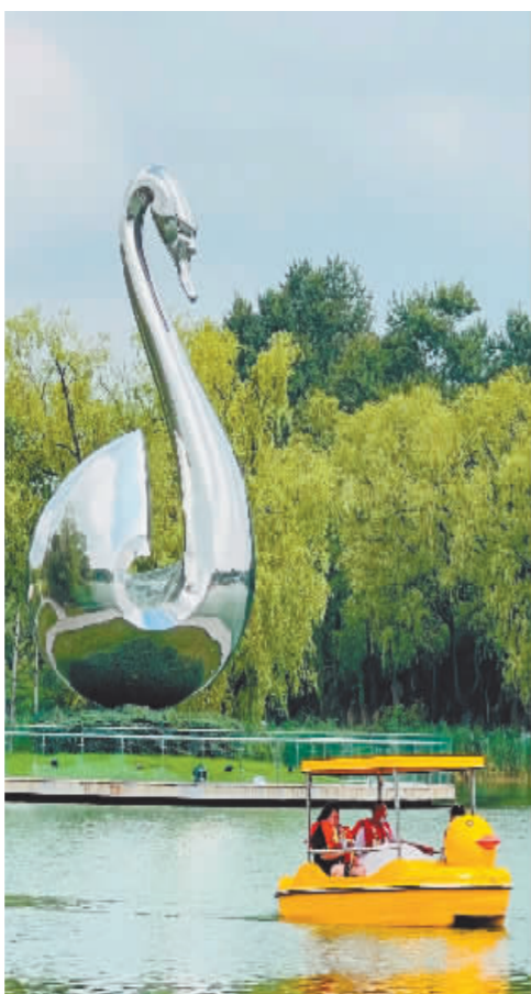
太阳岛碧水环绕，景色迷人。