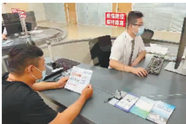
信用服务事项“一站式”办理。

本报讯(记者 张立馨文/摄)日前，市社会信用服务中心全面落实省“诚信七进”宣传发动部署要求，结合创建全国文明城市，深入开展市民大厦“诚信大厅”建设，弘扬诚信理念，打造“信用哈尔滨”品牌。