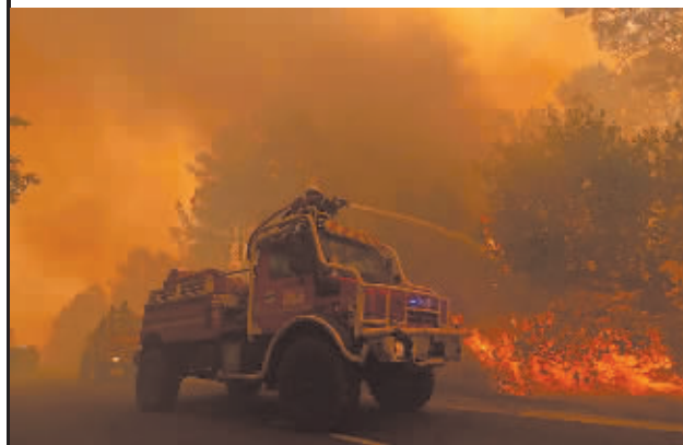
今年以来，法国累计已有5万多公顷森林被大火烧毁，这一数字是近十年来平均水平的3倍多。