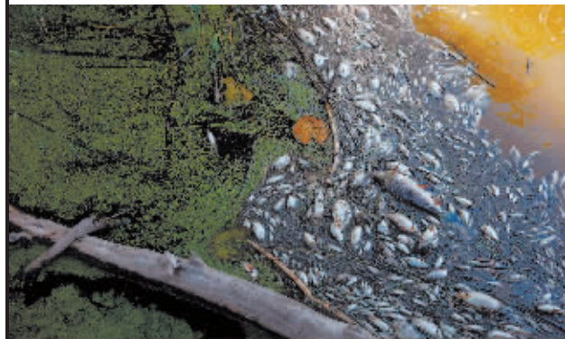
德国与波兰界河出现大量死鱼。