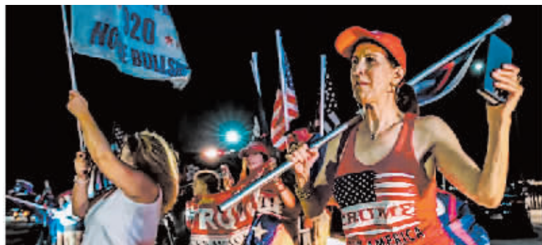
一些特朗普的支持者前往海湖庄园现场声援。

特朗普8日发表声明称，海湖庄园当天被大批联邦调查局人员包围和搜查。特朗普的律师对美国媒体透露，调查人员带走了十余个箱子，搜查令显示他们正在调查特朗普2021年1月离开白宫时将一些机密文件带到海湖庄园的相关行为。特朗普称，他之前已经配合了联邦政府相关机构工作，可海湖庄园仍遭搜查，这“不必要且不妥当”。