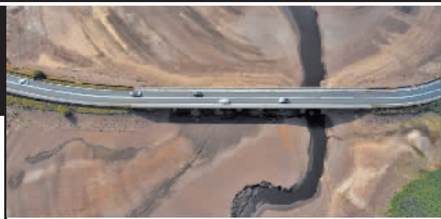
几近干涸的英国伍德黑德水库。