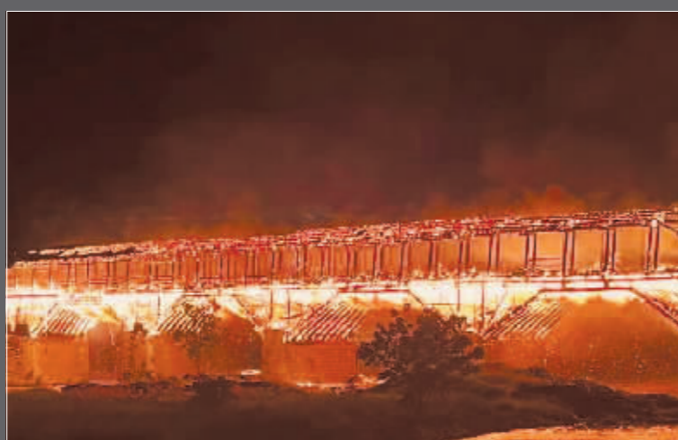
图为起火的万安桥和被烧毁的桥体。