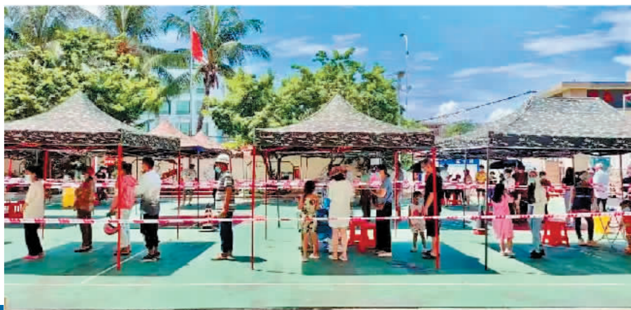
◀静态管理下的三亚城区。

目前，三亚、儋州均已实行临时性全域静态管理。万宁市也宣布，7日13时起实行临时性全域静态管理；琼海市自7日10时起，实行临时性全域相对静态管理。