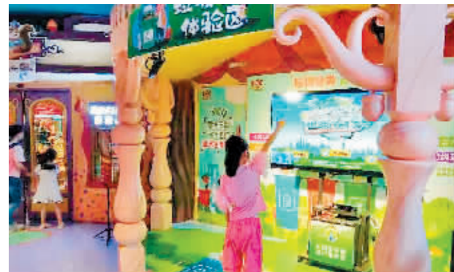
环保小达人参加垃圾分类主题活动。

本报讯(记者 霍亮文/摄)玩垃圾分类体感游戏、垃圾分类接力大赛、萝卜蹲……孩子们在边玩边学中,不知不觉成了环保小达人。7日上午,由香坊区生活垃圾分类领导小组联合哈平路街道办事处、松松小镇、香坊区生活垃圾分类执法中队、香坊区生活垃圾分类志愿者服务队,在香坊区松松小镇主题乐园开展了“我是环保小达人”垃圾分类主题活动。