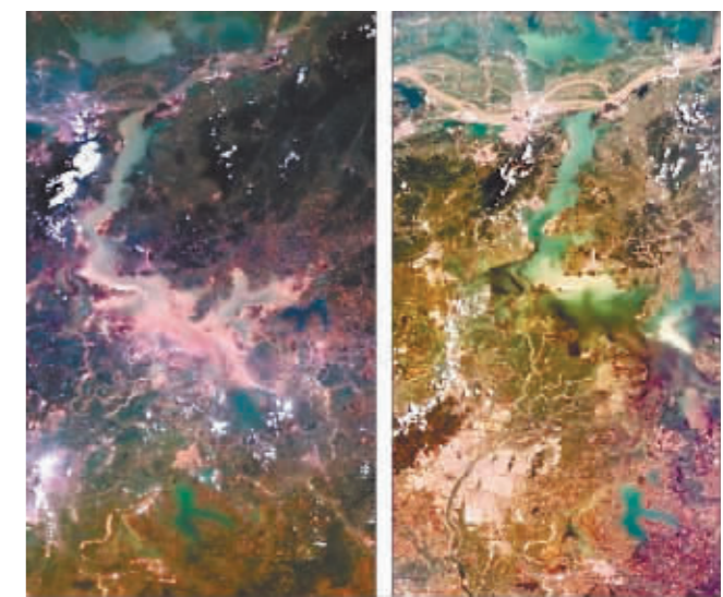
2022年8月2日与2021年8月31日鄱阳湖高分四号卫星遥感影像,鄱阳湖水域面积不到历史同期一半。

据新华社8月6日电 记者从江西省水文监测中心获悉,8月6日2时,鄱阳湖标志性水文站星子站水位退至11.99米,这意味着鄱阳湖提前进入枯水期。通过对比历史数据,2022年成为1951年有记录以来鄱阳湖最早进入枯水期的年份。