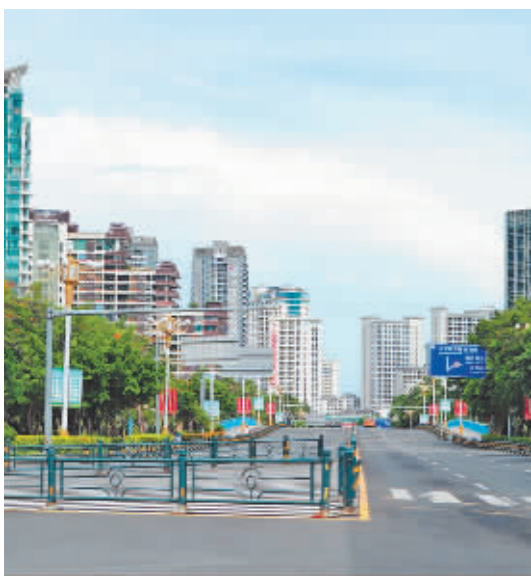
静态管理下的三亚街道。

三亚是知名旅游目的地,疫情发生正值暑期旅游高峰。三亚市副市长何世刚接受媒体采访时说,约有8万名旅客留在三亚。已要求包括行业协会在内的涉旅部门,努力为游客做好服务和安抚工作,及时告知游客相关政策。