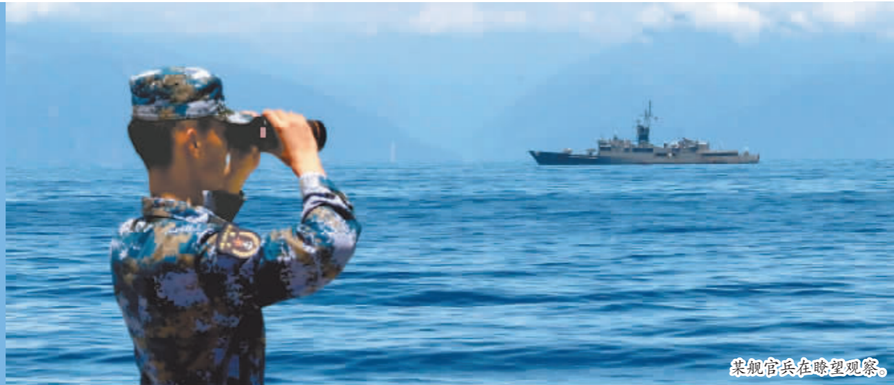
某舰官兵在瞭望观察。

据了解,在今天的行动中,东部战区海军任务部队还在战区统一指挥下,与东部战区空军任务部队一起,进行了联合侦察预警、联合火力突击等训练,部队在联合体系支撑下协同作战能力得到了检验提高。