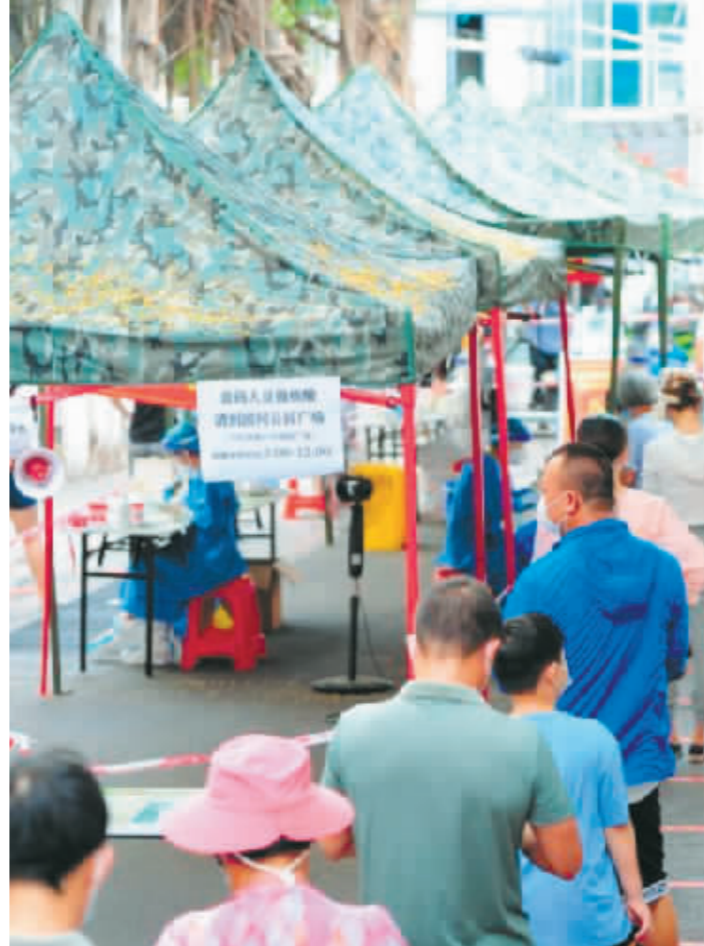
在海南三亚,居民排队进行核酸采样。

三亚5日深夜发布致全体市民和游客的一封信,期待大家从“我”做起,全力做到关注权威信息,做好核酸检测,严格自我管理,及时就医诊疗。三亚已启动退订专班工作机制,妥善做好因疫情等不可抗力因素导致的订单退订工作,切实维护广大游客的合法权益。