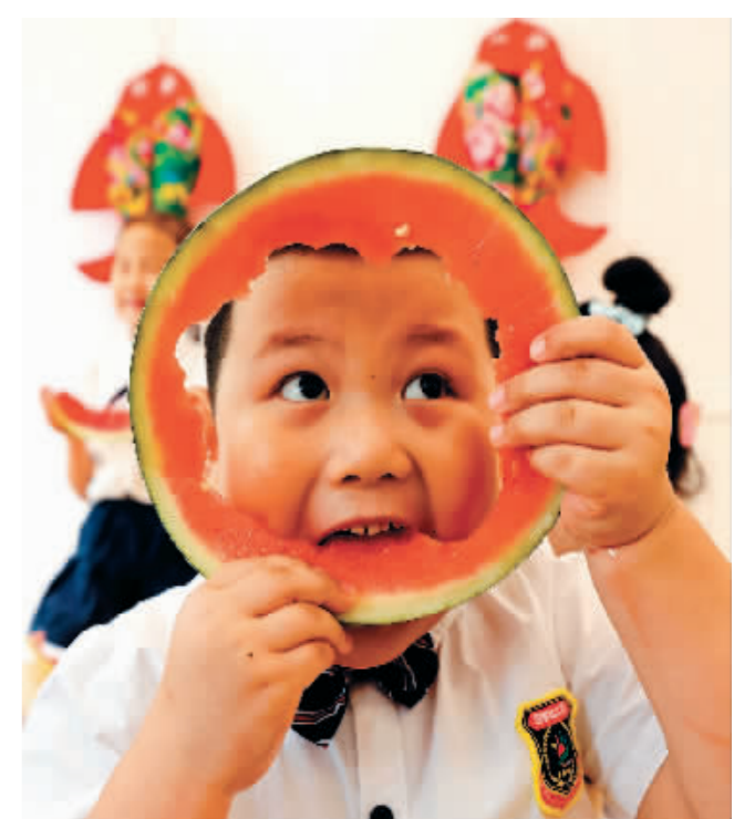
8月6日,山东省枣庄市龙山路街道一家幼儿园小朋友在吃西瓜“啃秋”。