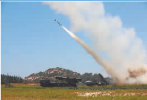
东部战区陆军某旅组织远火分队在台湾海峡组织实弹射击。