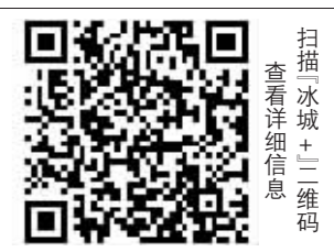
扫描“黑龙江人社”微信公众号二维码,查看详细证书信息。

今年全省职称评审工作于7月启动,评审工作原则上应于2022年12月底前结束,参评人员所有申报材料认定截止日期为2022年8月31日,任职资格从2022年9月1日开始计算。