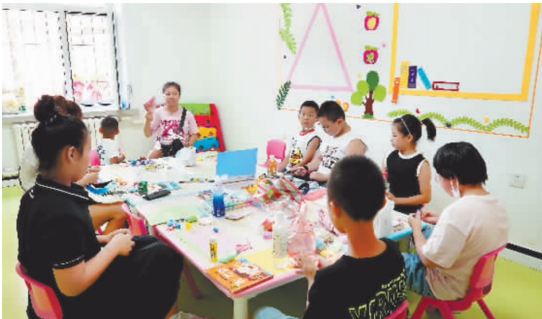
托管班内配备玩具、教具供孩子使用。

本报讯(记者 王丹/文 康松彦/摄)为解决进城务工人员子女暑期看护难题,4日,由哈尔滨物业集团主办、哈尔滨建设发展集团协助的哈市首个暑期公益进城务工人员子女托管班正式开班。托管班面向哈市进城务工人员子女,招收对象为5至10岁儿童,免费提供假期看护、学业辅导、文体活动及爱国主义教育等服务。