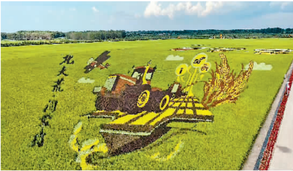
依托5G网络打造的数字示范农场。