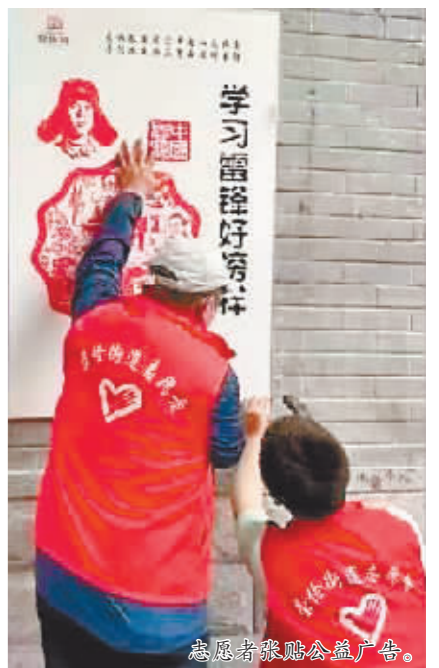
志愿者清除公益广告。

此外,针对居民小区薄弱环节存在的问题,结合人居环境综合整治开展专项行动,建立问题台账,责任落实到人,综合精准施策,确保整改取得实效。截至目前,崇俭街道累计粉刷外墙墙面300余平方米,清理庭院小广告500余处,楼道小广告1000余处,综合执法中队加大监督管理力度,并施划停车位、整理小区内挂线、清理乱占乱摆乱放。清理庭院8个,清理楼道340个,清运楼