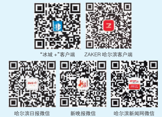
哈尔滨日报微信 新晚报微信 哈尔滨新闻网微信