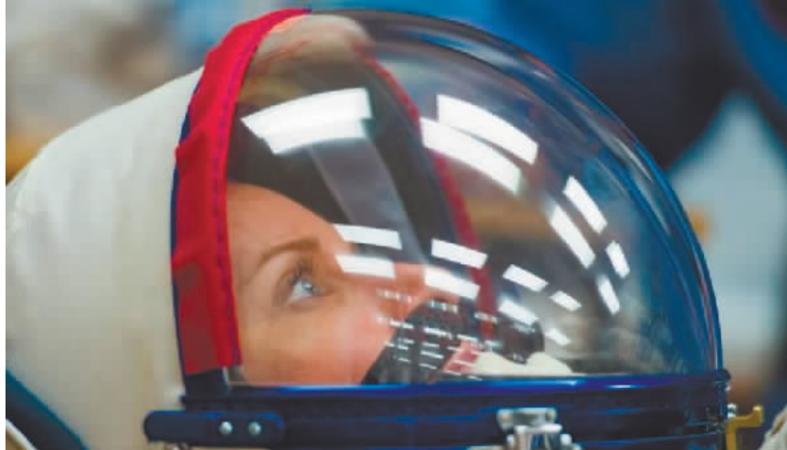
宇航员乘坐俄“联盟号”MS-17载人飞船,前往国际空间站。

要回溯俄美在航天探索上的恩怨史,不得不再提一下罗戈津,他是出了名的对美鹰派,西方眼中绝对的“麻烦制造者”。2014年克里米亚入俄时,罗戈津遭到美国制裁,惹起北约和美国来,完全不留情面。 在俄成功试射“萨尔马特”洲际导弹和北约成立73周年之际,罗戈津都在社交媒体上贴图,给北约送“大礼”。前一张图,是一名军人手持炸弹,炸弹上写有“给希特勒的礼物”字样;后一张图,是俄飞船在太空拍的北约总部俯瞰图,配文是“我们正在监视你们”。 罗戈津指责美国发动制裁,让俄无法进入国际微电子市场并失去商业订单,粗暴践踏了“太空无关政治”原则。他曾建议美国“使用蹦床”或者“派发扫帚”,将宇航员送往国际空间站。因为自2011年美国航天飞机历史性退役之后,所有美国宇航员必须搭乘俄飞船,才能往返国际空间站。 此外,美国对俄发起制裁后,美国国家航空航天局(NASA)曾迫于国会压力,在俄载人飞船上为美国宇航员买了一个天价座位,用户布支付。这正是罗戈津想要的效果,他亲自宣布了这个“打脸”美国人的消息。 罗戈津强烈的个人风格让这些年来俄航天局与NASA的关系跌至冰点。NASA最难以忍受的是,罗戈津曾警告,西方制裁将影响俄对国际空间站轨道的控制和校正,最终或导致500吨重的空间站“不受控地脱离坠落”。 美媒一度质疑,俄罗斯是否会因被制裁而拒将美国宇航员送回地球。但这是低估了罗戈津。3月30日,俄航天局安全地将一名美国宇航员和两名俄宇航员送了回来,帮助55岁的NASA宇航员马克·范德·海成功创下美国单次太空飞行最长飞行纪录。马克·范德·海正是NASA给“买座位”的那位。 罗戈津下台后,美媒叫好声一片,美国《国会山报》以“德里米·罗戈津被解雇无法拯救俄太空计划”为题嘲讽道,事实证明,罗戈津关于不对美国提供飞船的威胁是“空洞的”,因为他们今后可搭乘美国私营公司的飞船,往返空间站。 有分析称,俄军入乌以来多次作战动向被西方捕捉到并偷偷通知乌军,造成俄军战场上陷入被动,而罗戈津领导的俄航天局似乎未起到应有的反制作用。这或是罗戈津离开的原因。