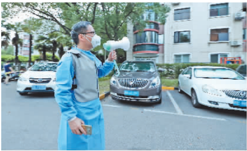
7月14日,在上海市一小区内,志愿者在通知居民进行核酸采样。

截至7月26日16时,共排查到这例阳性感染者在沪密切接触者151人,已落实隔离管控,核酸检测结果均为阴性。累计排查到密接的密接845人,已落实隔离管控,核酸检测结果均为阴性。累计筛查相关人员284816人,核酸检测结果均为阴性。累计排查相关场所的物品和环境样本145件,核酸检测结