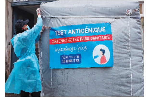
2022年4月1日,在法国巴黎一家药店外,工作人员固定新冠快速检测的牌子。

随着欧洲各国放松社会限制措施以及变异新冠病毒奥密克戎毒株的新亚型BA.4和BA.5扩散影响,欧洲近期新冠感染人数迅速增加。欧洲疾病预防控制中心专家认为欧洲已处在新一轮疫情中。