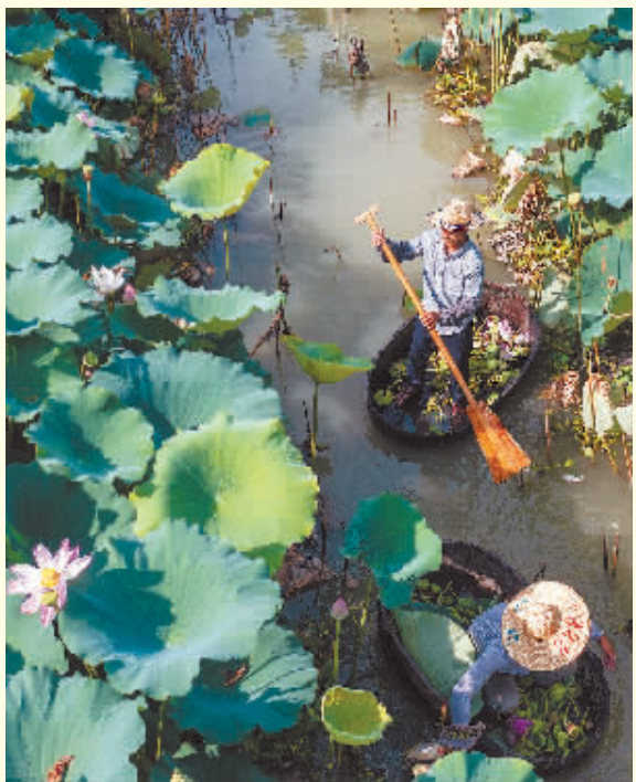
盛夏时节,浙江省湖州市吴兴区东林镇的数万亩荷塘内荷花绽放,莲蓬也已到采摘期,村民们划着菱桶在荷塘内采摘,开启水乡丰收季。