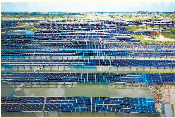
这是 7 月 21 日拍摄的大庆油田星火水面光伏项目。

日前,中国石油首个水面光伏项目——大庆油田星火水面光伏示范工程完成自主设计建设水面光伏的成功探索,实现并网发电。该项目利用两个水面,建设用地 40 万平方米,装机规模 18.73 兆瓦,年均发电 2750 万千瓦时,减排二氧化碳 2.2 万吨,助推“油城”新能源发展再次提速。