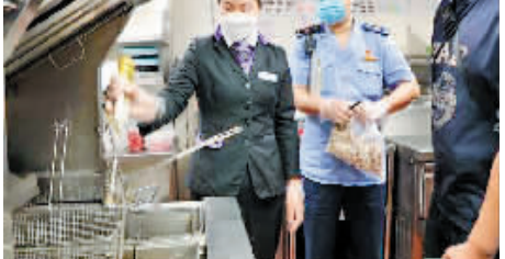
执法人员正在对涉事门店食品原材料进行检查。

当天,海淀区市场监管局部署对辖区内45家必胜客门店同步进行全覆盖检查,后续将对检查中发现的问题严格依法依规进行处理。