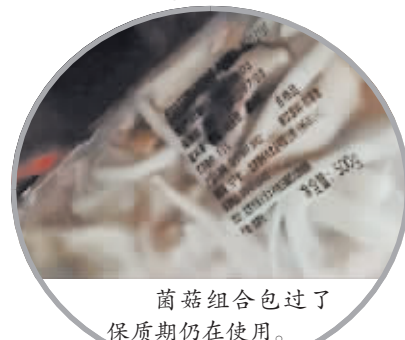
菌菇组合包过了保质期仍在用。