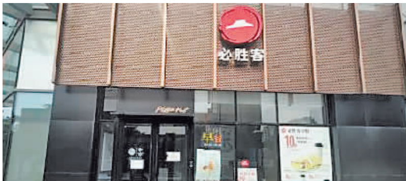
20日,必胜客涉事门店闭店。