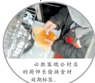
必胜客魏公村店的厨师长偷换食材效期标签。

但在实际执行的过程中却走了样。记者暗访半个月,发现篡改效期标签的情况,几乎每天都在必胜客后厨重复上演,而且这项“秘密工作”几乎全由餐厅的管理人员实施,普通的员工很难插手。篡改效期标签、食材不按时废弃的情况,在必胜客魏公村餐厅也经常出现。“前两天咱刚被检查完,所以这几天没有来检查的。”7月8日,一名老员工向记者透露,篡改效期标签这种事是店里默认的“潜规则”,“这种事老大他们也是睁一只眼闭一只眼。”