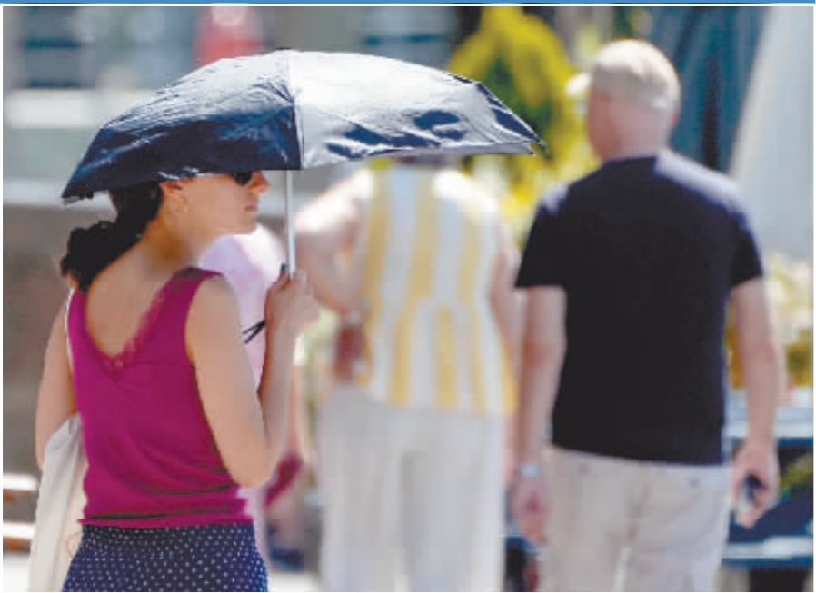
英国气象局15日发布红色高温预警,英格兰部分地区18日和19日将迎来极端高温天气,最高气温可能刷新纪录,突破40摄氏度。图为7月15日,在英国伦敦,一名女子撑伞遮阳。