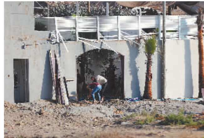
7月16日,巴勒斯坦人在加沙地带查看空袭过后的废墟。

新华社加沙7月16日电 以色列国防军16日凌晨出动战机对加沙地带巴勒斯坦伊斯兰抵抗运动(哈马斯)军事目标实施空袭,以报复当天早些时候来自加沙地带的火箭弹袭击。