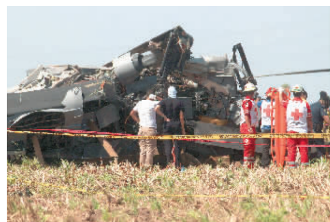
7月15日,在墨西哥锡罗亚州洛斯莫奇斯,救援人员站在坠毁的“黑鹰”直升机残骸旁。

新华社墨西哥城7月15日电 墨西哥军方15日发布公告称,一架军用直升机当天在墨西哥锡罗亚州坠毁,造成至少14人死亡。