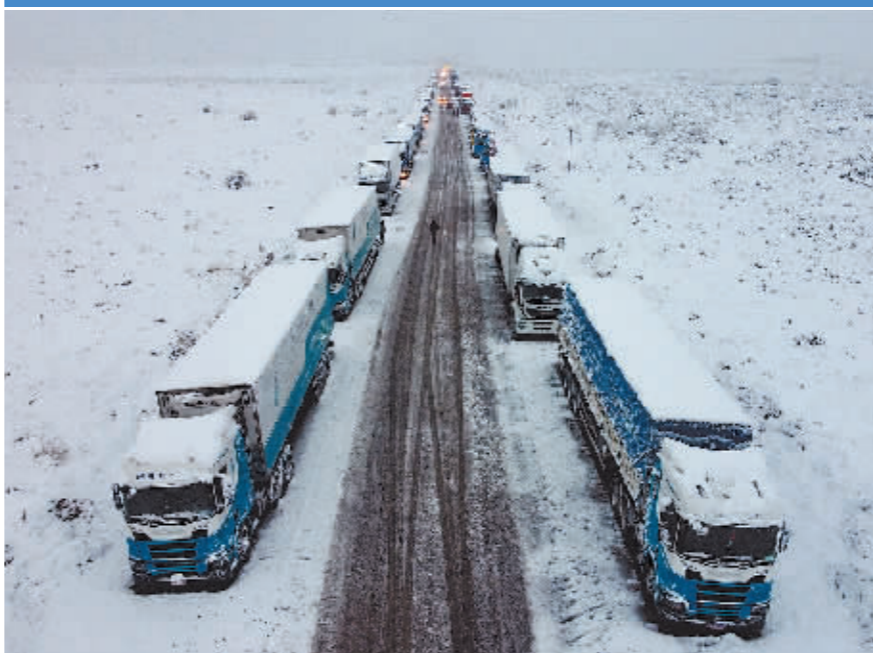
阿根廷与智利交界处的安第斯山区近日遭遇暴风雪,连接阿根廷和智利的山路受损。图为7月15日,在阿根廷门多萨省,被困的卡车停在道路两旁。新华社发