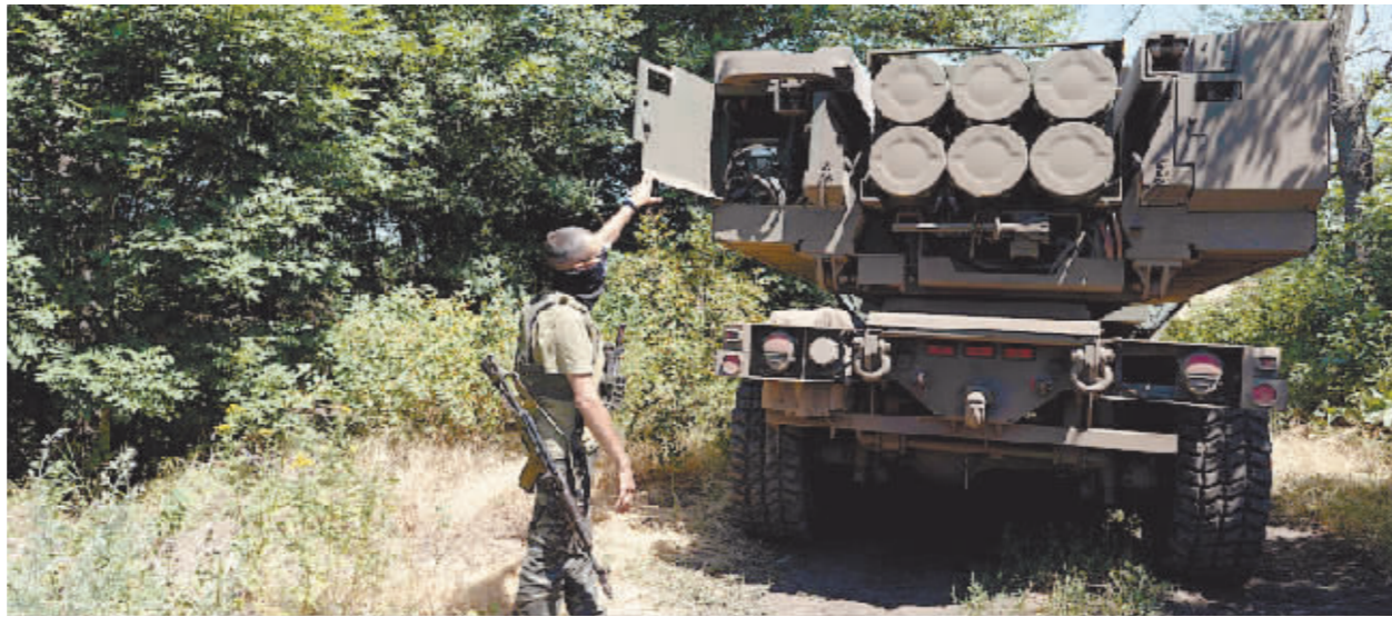
7月6日,俄军使用高精度空基导弹打击了乌军在顿涅茨克地区的“海马斯”多管火箭炮系统和弹药库。

乌军方称,乌防空系统拦截了俄图-95战略轰炸机向中部第聂伯罗发射的多枚导弹。南部的敖德萨等地也遭俄导弹打击。乌方还称,最近几周,乌军打击了30多个俄军事后勤中心。