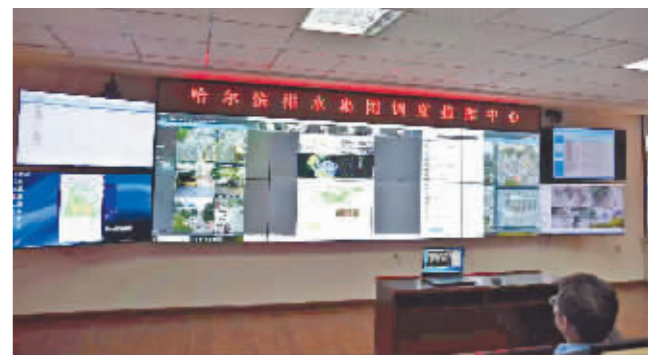
24小时实时监控城市排水情况。

本报讯(记者 王丹)7月13日,市气象台发布降雨信息,预计今天夜间到明天傍晚以混合性降雨天气为主。为应对降雨带来的影响,哈排水集团与交警部门、气象台联动,提前部署防汛预案。截至17时,700余名排涝人员已全部上岗待命,出动246台(套)车辆、设备对全市低洼地带、易涝区域密切监控,并加强路面巡视,泵站提前开泵运行,降低系统水位,确保雨水正常排放。