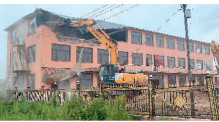
违法建筑被依法拆除。

据了解,机场扩建二期东二跑道项目作为建设“主战场”,是全省重点基础设施工程之首,事关改革发展大局和国计民生福祉。(下转第六版)