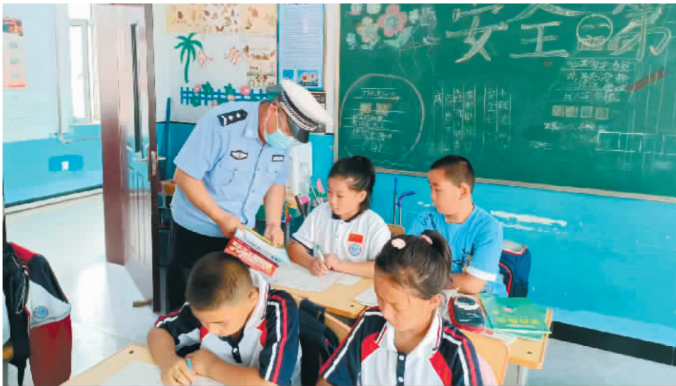
交警在课堂上宣传交通安全知识。

本报讯(孙鹏飞 记者 郝欣)一年一度的暑假即将来临,为了让同学们度过一个平安、快乐的暑假,7月6日上午,延寿县公安局交警大队民警深入辖区中小学校,以交通安全“六要”“六不要”为主题开展交通安全知识宣传活动,为学生们开展暑假前最后一堂交通安全课。