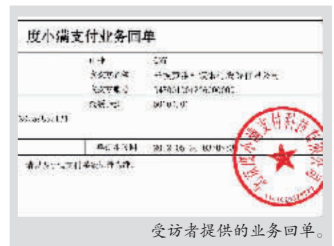
受访者提供的业务回单。