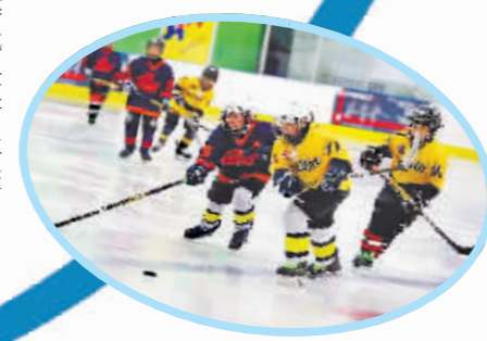
哈尔滨冰球俱乐部挑战赛。