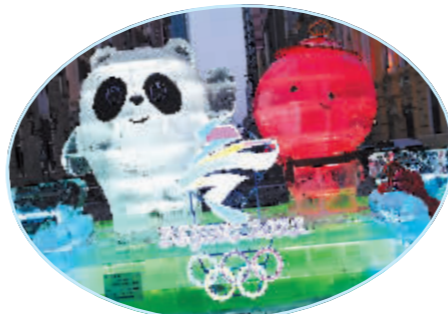
中央大街冬奥冰景。

会议强调,要在解放思想中躬身实干,强力整治不良作风,系统治理腐败问题,持续深化不敢腐、不能腐、不想腐一体推进,坚决整治群众身边“微腐败”,深入开展破坏营商环境问题专项整治行动,聚焦稳经济促发展各项措施落实,助力经济社会高质量发展。要在解放思想中锻造队伍,政治上要忠诚,能力上要过硬,作风上要优良,纪律上要严明,建设政治过硬本领高强的纪检监察铁军。