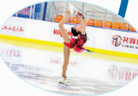
哈市中小学生花样滑冰比赛。