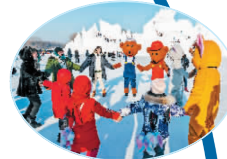
太阳岛雪博会迎八方客。