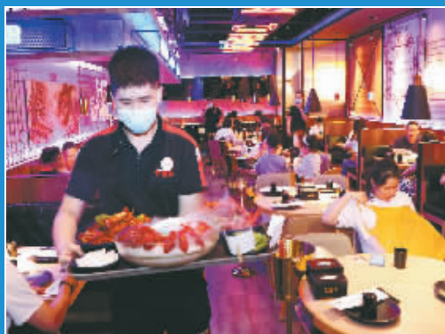
上海有序恢复餐饮堂食。