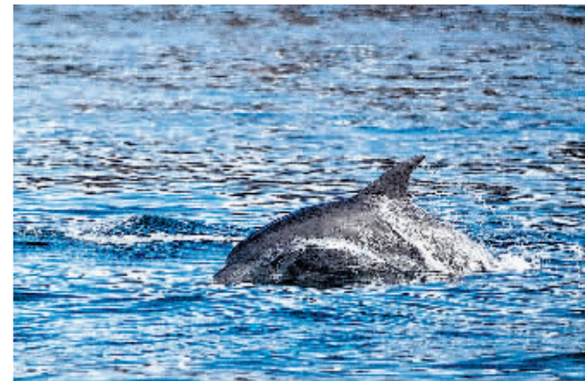
6月15日,海豚在南非开普敦福尔斯湾嬉戏。

据新华社电 2022年联合国海洋大会7月1日在葡萄牙首都里斯本落下帷幕。与会各方一致通过里斯本宣言,同意加大基于科学和创新的海洋行动力度,以应对当前的海洋紧急情况。