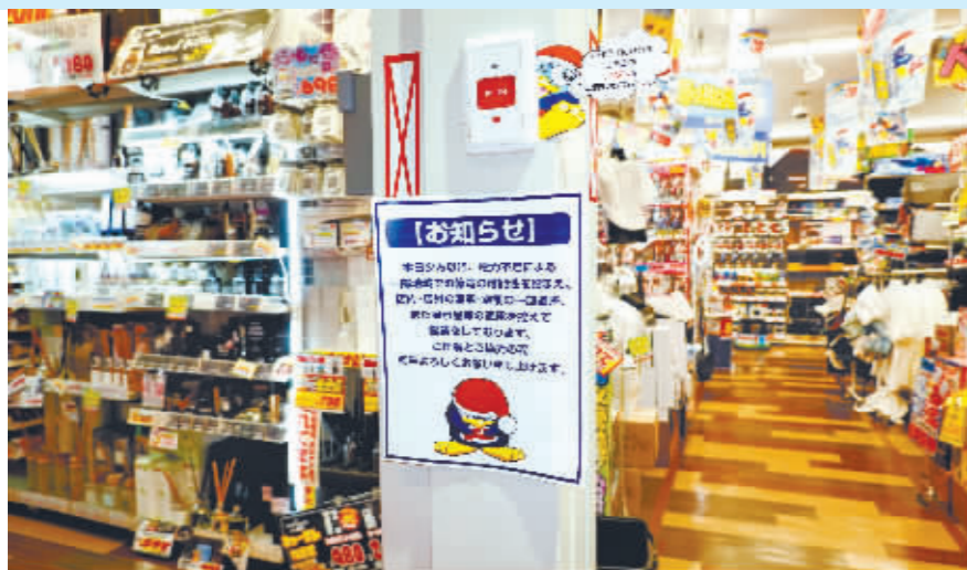
7月2日,日本东京一家超市张贴节电通知。