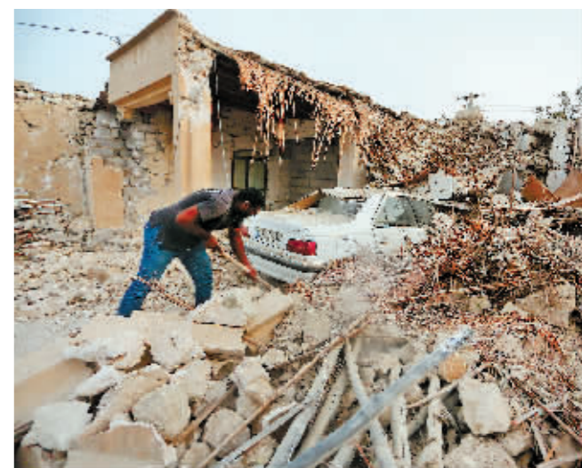
伊朗法尔斯通讯社报道,伊朗南部2日凌晨发生3次6级以上地震,目前已造成5人死亡、49人受伤。

图为7月2日,在伊朗南部霍尔木兹省的一个村庄,一名男子清理倒塌建筑的废墟。