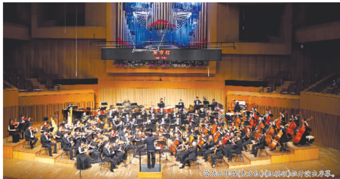
管弦乐作品《东方红》《红旗颂》拉开序幕。

本报讯(王建昭 记者 于秋莹)7月1日晚,喜迎党的二十大系列音乐会——“庆‘七一’把一切献给党交响音乐会”震撼上演。