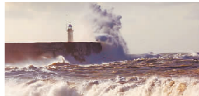
海浪拍打英国纽黑文港口的堤岸。

据新华社电 英国《自然》杂志日前称,气象学家已连续第三年预测拉尼娜现象,即可能发生罕见的“三重”拉尼娜气候事件,对全球气候产生深远影响。伴随全球变暖,类似情况可能会更加普遍。研究人员指出,当前拉尼娜现象始于 2020 年 9 月前,此后多数时间都处于轻度至中度状态,到 2022 年 4 月,它愈演愈烈,导致赤道东太平洋上空出现自 1950 年以来罕见的寒流。世界气象组织日前发布最新预测显示,当前拉尼娜现象持续到 7 月或 9 月的可能性为 50%至 60%。美国国家海洋和大气管理局预测,拉尼娜现象持续到 2023 年初的可能性为 51%。拉尼娜和厄尔尼诺现象一般每两到七年发生一次,中间有中性年。厄尔尼诺是太平洋赤道中东部海水温度异常升高引起的一种气候现象,拉尼娜则与之相反,指太平洋该区域海温连续一段时间低于正常年份温度。如果厄尔尼诺现象很强,可能导致后续拉尼娜现象持续两年甚至三年时间。研究人员说,北半球出现连续两个拉尼娜冬季很常见,但连续三个比较少见。自 1950 年以来,持续三年的“三重”拉尼娜现象仅发生过两次。但不同的是,此次如果出现“三重”拉尼娜现象,并不是发生在强厄尔尼诺现象之后。研究人员警告说,气候变化也许会导致未来更可能出现类似拉尼娜气候事件。更多拉尼娜事件将增加东南亚发生洪水的几率,增加美国西南部发生干旱和山火风险,并在太平洋和大西洋形成多种飓风、气旋和季风模式,以及引发其他区域的天气变化。联合国政府间气候变化专门委员会最新报告显示,自 1950 年以来,强厄尔尼诺和拉尼娜事件比之前几个世纪更频繁和剧烈,但专家组尚无法判断这是否由气候变化引起。