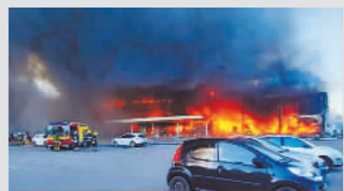
乌克兰一购物中心燃起大火。

俄罗斯总统新闻秘书佩斯科夫 28 日说,俄特别军事行动结束没有大致期限。他在评论泽连斯基有关计划到冬前结束战争的言论时表示,如果乌克兰能够命令民族主义者放下武器并满足俄方条件,特别军事行动今天就可以结束。俄罗斯外交部 28 日发表声明说,作为对美方不断扩大对俄政治和公众人物制裁的回应,俄方决定无限期禁止 25 名美国公民入境,其中包括美国总统拜登的妻子吉尔和女儿阿什莉。俄罗斯国防部发言人科纳申科夫 28 日通报,俄军 27 日使用高精度武器摧毁了位于波尔塔瓦州列别丘格市存储美欧提供武器弹药仓库,武器弹药爆炸致附近一家已停业的购物中心发生火灾。他还说,俄空军对哈尔科夫市一“亚速营”驻点和哈尔科夫州一居民点附近的第 92 摩托化步兵旅下属某营实施打击,消灭 100 多名乌军及外国雇佣兵,摧毁 15 辆装甲车。乌克兰国家通讯社 28 日援引乌各地军事部门的消息报道,截至当日上午,俄军持续对赫尔松、切尔尼夫、苏梅、哈尔科夫等地区进行炮击。在卢甘斯克地区,俄军正从南部和西南部对利西昌斯克市发动进攻,试图阻断这座城市与顿涅茨克地区的交通联系。在顿涅茨克地区,俄军的炮击沿整个前线展开,斯拉维扬斯克、托列茨克等城市均遭打击。泽连斯基 27 日在社交媒体发文称,乌中部列别丘格市一座商场遭导弹袭击,遂引发大火,袭击发生时商场内有上千名平民。泽连斯基 28 日在社交媒体上说,他与北约秘书长斯托尔滕贝格通电话,就北约马德里峰会协调了立场。他在通话中强调了在乌克兰部署导弹防御系统以防止俄罗斯攻击的重要性。法国国防部长塞巴斯蒂安·勒科尔尼 27 日晚接受法国媒体采访时宣布,法国将向乌克兰提供“数量较多”的装甲运兵车。