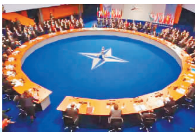
北约峰会会场。(资料片)

七国集团(G7)和北大西洋公约组织(北约)将从26日起接连举行峰会。分析人士指出,这两场峰会暴露出以美国为首的西方国家企图利用G7、北约这两大集团主导国际秩序。谋合作、促发展本是不可抗拒的时代潮流,而美国等一些西方国家固守冷战思维,为了维护自身霸权,拉帮结派搞“小圈子”。这种做法逆流而动,注定不会得逞。