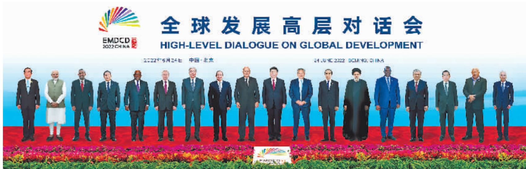
左图:6月24日晚,国家主席习近平在北京以视频方式主持全球发展高层对话会并发表题为《构建高质量伙伴关系 共创全球发展新时代》的重要讲话。