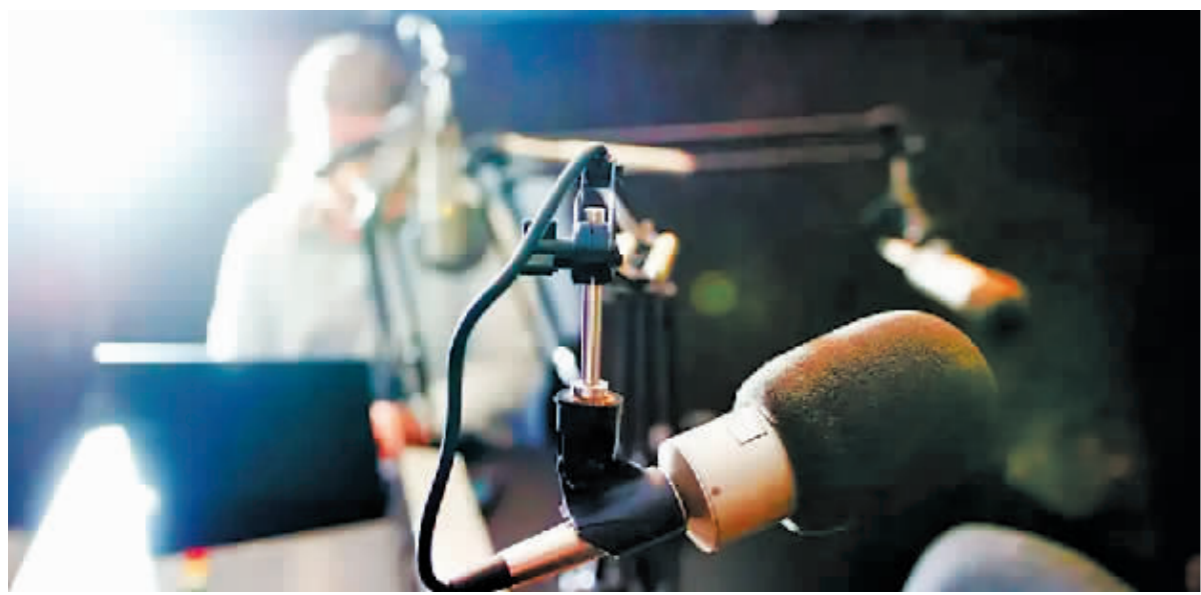
一名网络主播在进行网上直播。

网络表演、网络视听经纪机构要依法合规为网络主播提供经纪服务,维护网络主播合法权益。平台和经纪机构规范网络主播情况及网络主播规范从业情况,将纳入文化和旅游行政部门、广播电视行政部门许可管理、日常管理、安全检查、节目上线管理考察范围。