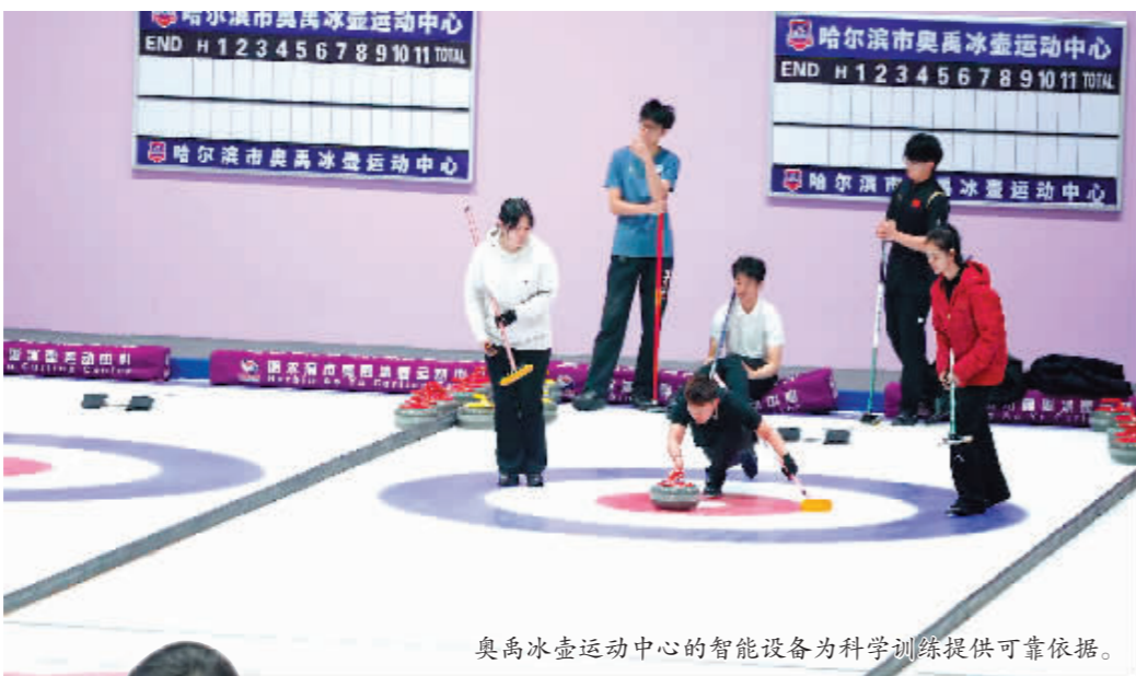
奥禹冰壶运动中心的智能设备为科学训练提供可靠依据。