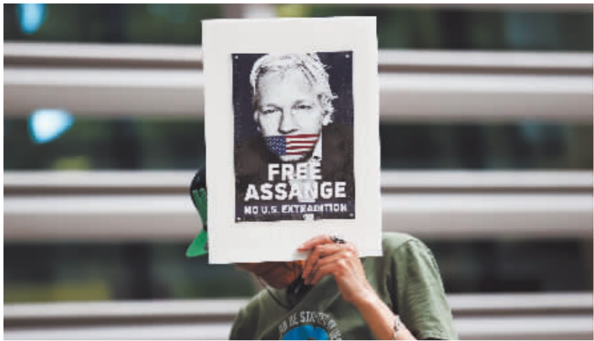
示威者在位于伦敦的英国内政部大楼门前手举“释放阿桑奇”标语。

英国内政部在最新声明中说,英国法院在本案中并未发现引渡阿桑奇会使他面临“压迫、不公正或程序滥用”,也没有发现引渡将使阿桑奇的人权受到侵犯。声明同时说,阿桑奇可在14天内提出上诉。