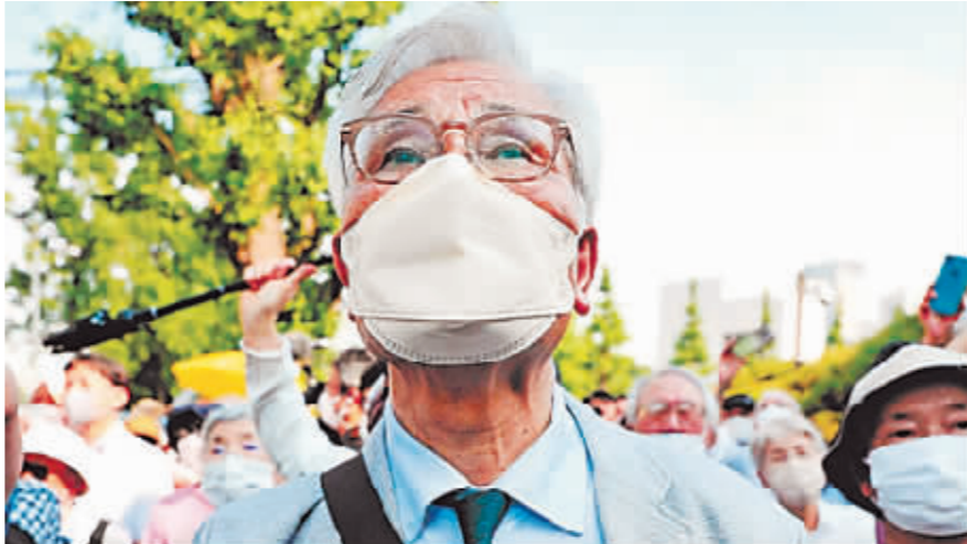
民众在日本最高法院前怒斥判决结果有违正义。

这是最高法院首次就日本政府是否应当为福岛核事故承担国家赔偿责任作出裁决。共同社解读,这势必会作为判例影响今后的类似诉讼。